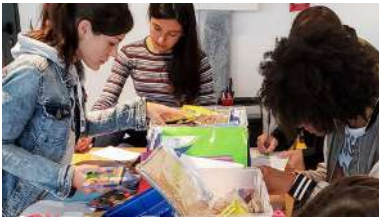
As estadias reuniron alumnado de diferentes países e titulacións.