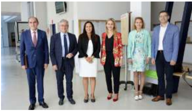
Imaxe de coordinadoras e participantes.