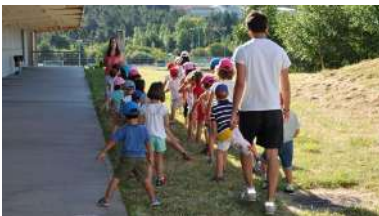
Nenas e nenos participantes nunha edición anterior.

Despois de 17 intensos días de programación, a XXIV edición da Mostra Internacional de Teatro Universitario de Ourense (Miteu) baixou este sábado o pano coa entrega de galardóns e coa actuación da Aula Universitaria de Ourense Maricastaña. Aínda despedindo ás compañías internacionais que participaron nos últimos días, desde a organización do certame salientan os bos resultados desta edición, tanto en calidade como cantidade. +info.