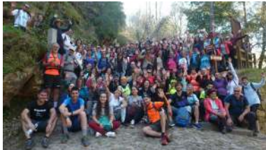
Imaxe de grupo dunha das andainas.

Dentro das accións contempladas na estratexia de Crecemento Azul (Blue Growth) que está a desenvolver, o Porto de Vigo acaba de poñer en marcha o proxecto Peiraos do Solpor , unha iniciativa na que participan entidades públicas e privadas co obxectivo de incrementar a biodiversidade do porto vigués, a través da redución de emisións e o incremento na captación de CO 2 . +info.