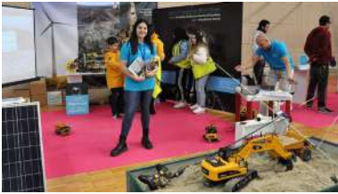
Preto de 350 escolares participan na EE Forestal na fase final de Ponteciencia.