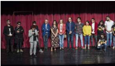
Imaxe da gala de peche celebrada o sábado no Teatro Principal de Ourense.