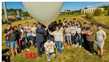
O lanzamento tivo lugar na Tecnopolo.