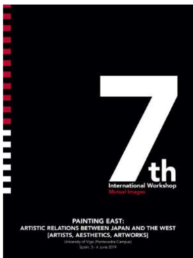
O "workshop" de Mutual Images desenvolverase os días 3 e 4 de xuño.

As influencias mutuas, a interacción artística e o intercambio cultural entre Oriente e Occidente e, nomeadamente, entre Europa e Xapón, tanto na arte e na estética, como na fotografía, na cultura popular, no deseño e na moda. Estes serán os eixos da análise do sétimo workshop internacional da asociación de investigadores Mutual Images , que os días 3 e 4 de xuño se desenvolverá na sede da Vicerreitoría do campus. Unha vintena de investigadores e investigadoras, procedentes de universidades de España, Xapón Reino Unido, Estados Unidos, Portugal e Líbano protagonizarán un simposio que, da man do grupo de investigación dx5, da Facultade de Belas Artes, desenvolverase por primeira vez en España. +info.