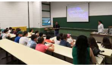
A través da actividade "Descubriendo o norte"