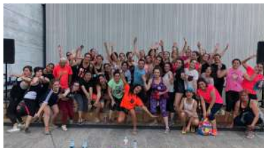
Participantes na actividade de zumba.