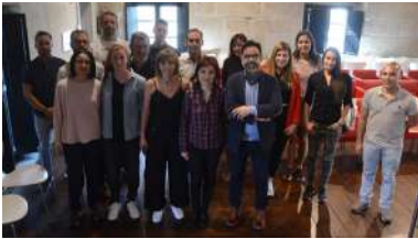
Os e as participantes na xuntanza, xunto co vicerreitor do campus.