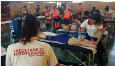
Preto de 50 estudantes cun evento que reuniu preto de 4000 deportistas.

O grupo de investigación HealtyFit, da Facultade de de Ciencias da Educación e do Deporte, é un dos socios do proxecto europeo In Common Sports (Intergenerational Competition as Motivation for Sport and Healthy Lifestyle of Senior Citizens) , que ten como obxectivo central a análise dos factores que motivan ás persoas maiores a realizar deporte e actividade física e no que participan institucións académicas e municipais de España, Portugal, Italia, Hungría e Bulgaria. +info.