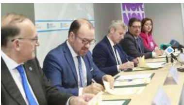
As institucións académicas desenvolverán medidas previstas no Pacto de Estado