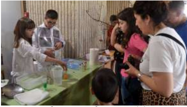
Preto de 350 escolares participan na EE Forestal na fase final de Ponteciencia.