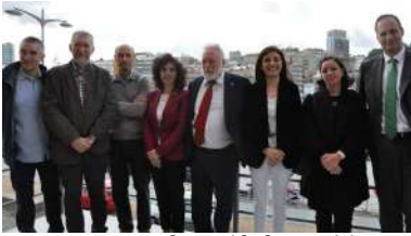
Representantes das entidades participantes no proxecto..