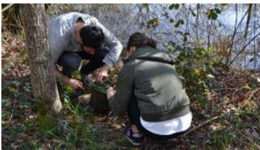
Alumnado realizando tarefas de voluntariado.

Pór de manifesto as desigualdades existentes entre homes e mulleres a través do intercambio de roles tradicionais, analizar a linguaxe sexista nas traducións ou a representación da muller nos dicionarios, deseñar materiais que contribúan á incorporación da perspectiva de xénero ás aulas, abordar a existencia de profesións e estudos feminizados e afondar nas desigualdades entre homes e mulleres no ámbito científico tecnolóxico. +info.