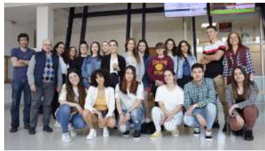
Alumnado que participará nos seminarios nas dúas universidades alemás.