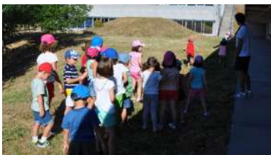
Participantes nunha edición anterior deste campamento no campus de Vigo.