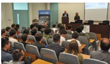
Trata de mellorar a calidade da educación ao proporcionar contextos docentes máis motivadores.

Cursan Global Studies and World Languages , un programa multidisciplinar centrado nas competencias lingüísticas e interculturais e, para completar a súa formación están a visitar España. Trátase dun grupo de estudantes da Winona State University de Minnessota que, dentro desta viaxe de estudos elixiron o campus de Vigo como un dos seus destinos. Na xornada de onte luns achegáronse a coñecer a Facultade de Filoloxía e Tradución, as instalacións e infraestruturas e o Centro de Investigacións Biomédicas. +info.