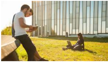
Esta é a primeira convocatoria destas características que realiza a Universidade.