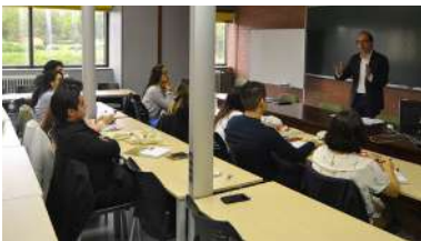
Estudantes da Universidad Anáhuac fórmanse desde este luns em CCSS e da Comunicación.

O pasado sábado, Pontevedra celebraba a clausura do Campionato do Mundo Multisport da International Triathlon Union (ITU) , que entre o 27 de abril o 4 de maio reuniu na cidade preto de 4000 deportistas e que supuxo así mesmo unha oportunidade para entrar en contacto con casos clínicos reais para preto de 50 alumnos e alumnas da Facultade de Fisioterapia, que participaron nas unidades de voluntariado coas que o centro colaborou co evento. +info.